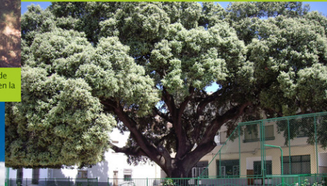
La Carrasca: Arbol milenario situado en el colegio Cristo Crucificado de Elche de la Sierra. Tiene 4,6 metros de cuerda (Elche de la Sierra)