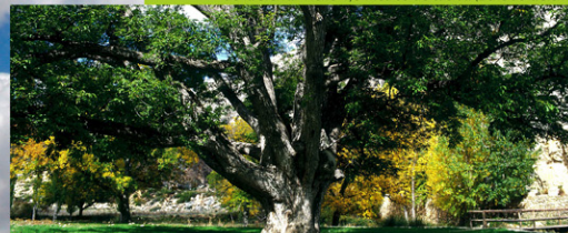
Plantón del Covacho: Nogal de 6 metros de cuerda rondando los 500 años situado en la carretera de Pedro Andrés (Nerpio). Hay que indicar que hace muy poco tiempo se ha secado por viejo.