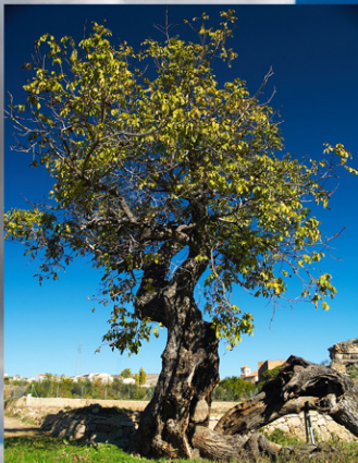
Noguera del Arco: Nogal de antigüedad considerable. Se remonta a la época musulmana y está entre los nogales más viejos de Europa (Socovos).