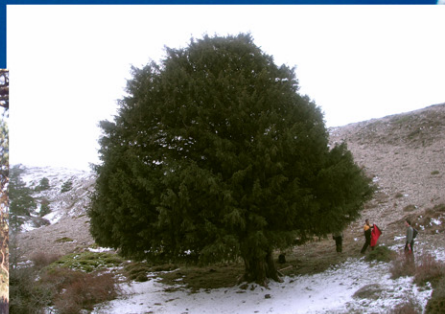
Tejo del Calar del Mundo: Tejo milenario situado en la zona nororiental del macizo kárstico del Calar del Mundo (Yeste)