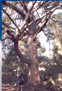
Pino el Toril: Pino laricio de 4,10 metros de cuerda y unos 25 metros de altura, situado en la Sierra del Agua (Molinicos)